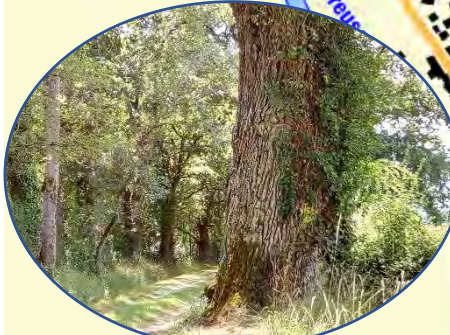
Chêne de la Grosse Taille