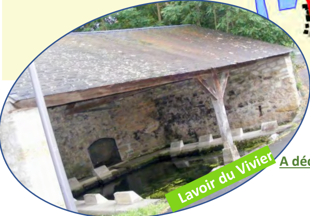
Lavoir du Vivier