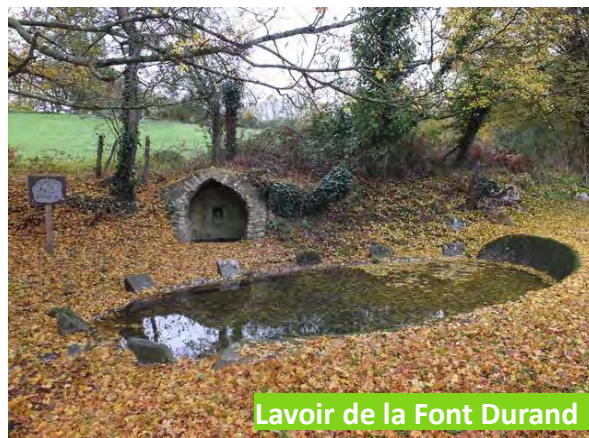
Lavoir de la Font Durand

En savoir plus sur : www.le-pechereau-mairie.fr