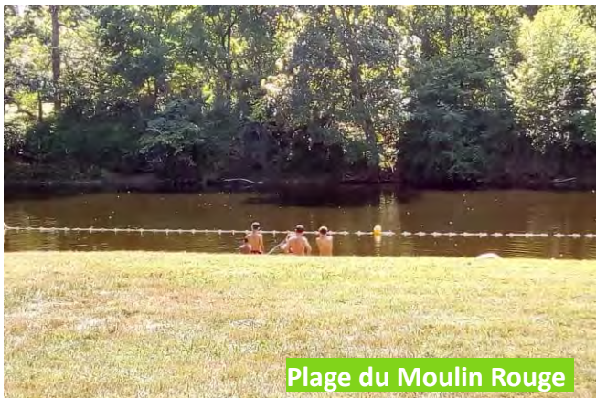
Plage du Moulin Rouge