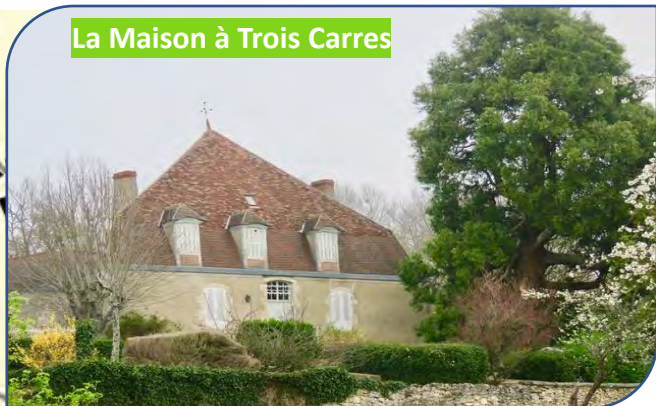
La Maison à Trois Carres