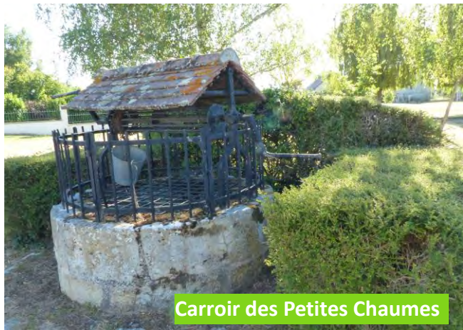
Carroi des Petites Chaumes