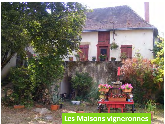
Les Maisons vigneronnes