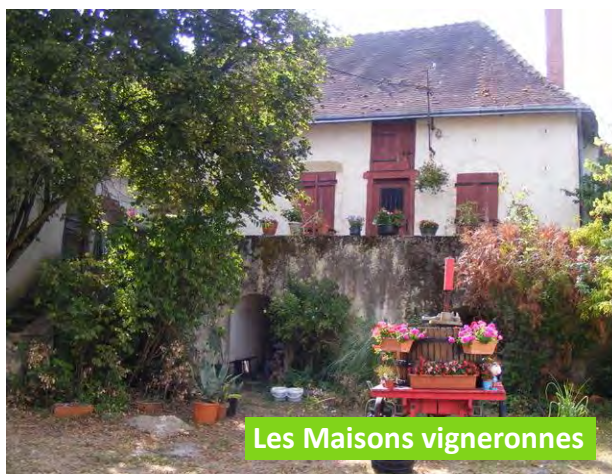
Les Maisons vigneronnes