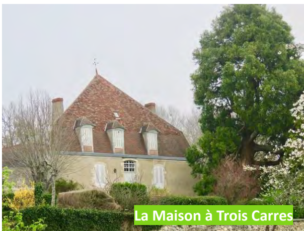
La Maison à Trois Carres