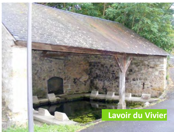
Lavoir du Vivier