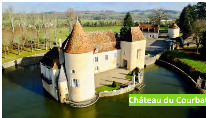
Château du Courbat

En savoir plus sur : www.le-pechereau-mairie.fr