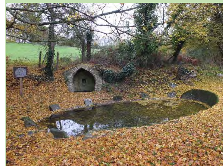
Lavoir de la Font Durand