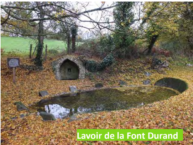
Lavoir de la Font Durand