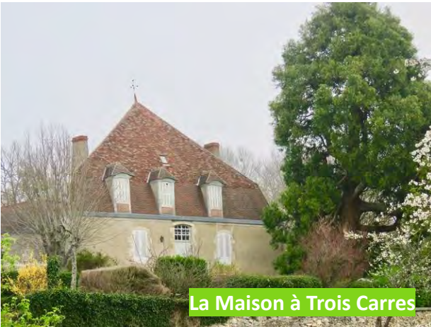
La Maison à Trois Carres